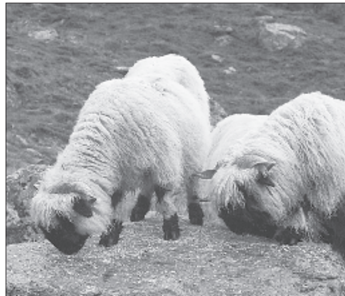
Schwarznasen, ein Oberwalliser Pendant zu Eringerkühen.

Was den Eggerberger Schäfern beim ganzen Projekt wichtig war: Gefilmt wurden tatsächliche Situationen aus ihrem Alltag – gestellt wurde nichts. «Der Film setzt sich mit unserem Leben und unserer Arbeit auseinander. Dabei Posen zu machen, das lag nicht drin», bringt Rein-